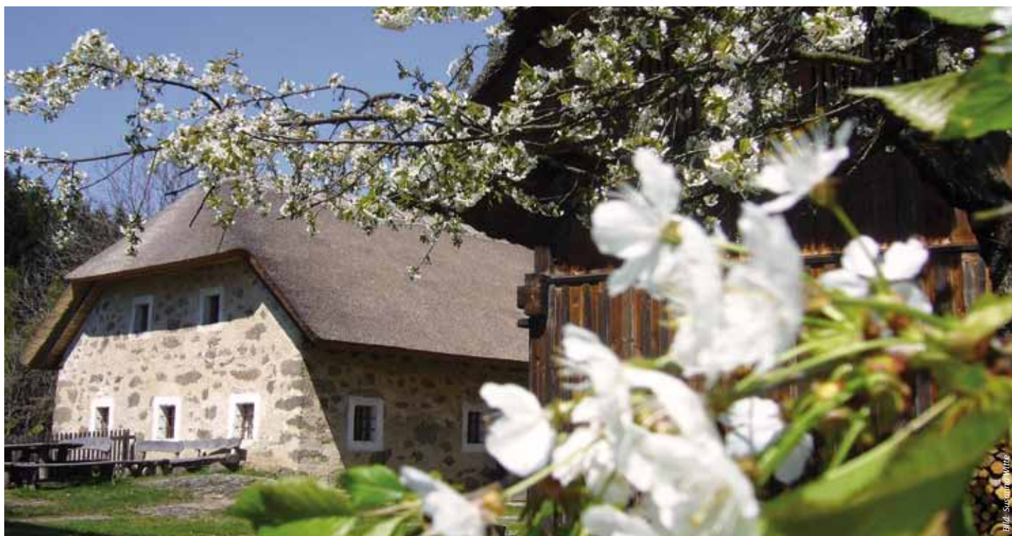
Das Freilichtmuseum Großdöllnerhof in Rechberg

Dazu ist 2008 eigens ein Dachdecker aus Holland engagiert worden, der sein Handwerk versteht. Der Großdöllnerhof ist aber auch modern: Unter dem Dach im ehemaligen Wirtschaftstrakt befindet sich seit 2019 ein Seminarraum mit EDV-Ausstattung und einer Bewirtungsmöglichkeit für die Gäste. Lernen Sie eine Zeit kennen, in der man noch an bösen Zauber glaubte!