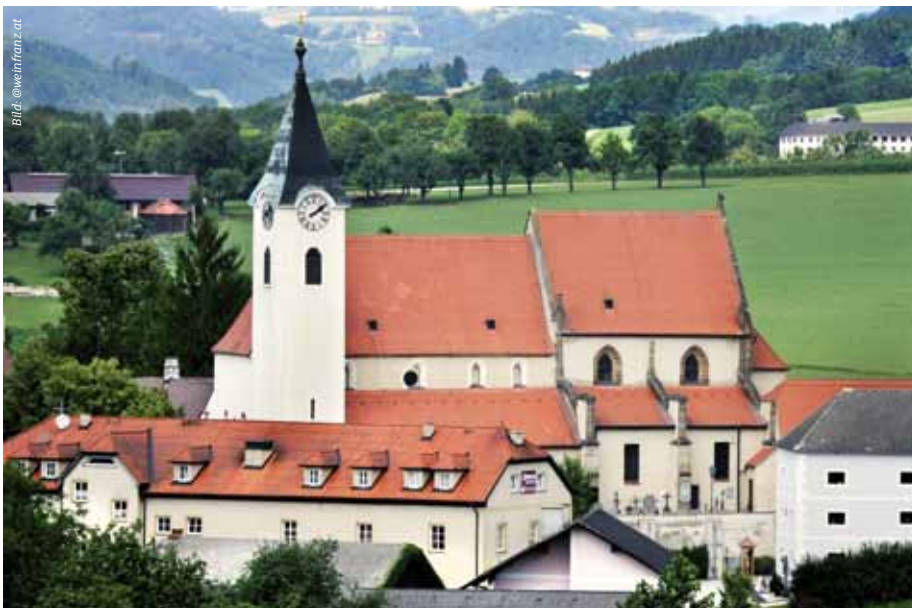
Die Stiftskirche Ardagger.

3321 Ardagger Markt, Markt 55 Tel.: +43 (0)7479 73 12, E-Mail: tourismus@ardagger.gv.at Internet: www.ardagger.gv.at