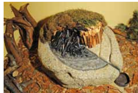
Der Holzkohlenmeiler wurde in Rechberg als Modell nachgebaut.

Das Dach haben die Rechberger liebevoll mit Reet aus dem Burgenland decken lassen.