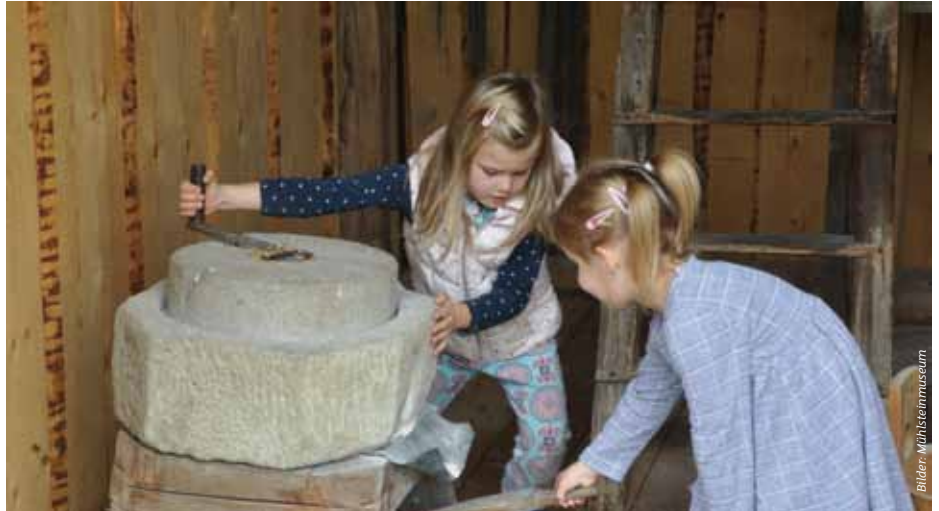
Die Besucher können hier nachvollziehen, wie einst Mehl gemahlen wurde.

Das Mahlen von Getreide ist eine der ältesten Kulturtechniken der Menschheit und untrennbar mit der Sesshaftwerdung der Menschen verknüpft. Es werden 8.000 Jahre alte Handmühlen aus Afrika ausgestellt, bis hin zum Mühlstein des letzten Mühlsteinerzeugers in Österreich, der