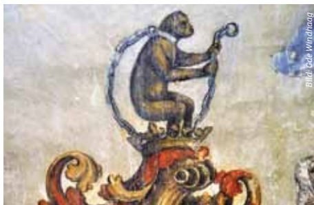
Die Prager wählten Affen als ihr Wappentier. 4322 Windhaag bei Perg, Altenburg 2 Tel.: +43 (0)7264/4255