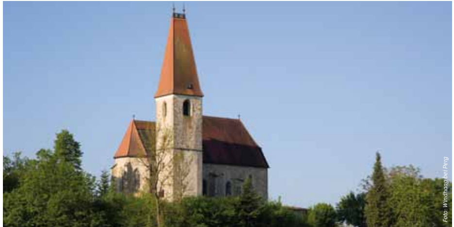
In der Filialkirche Altenburg beeindrucken die 500 Jahre alten Fresken.

Neben der Filialkirche befindet sich die Alte Schule, in der heute das Museum „Der Graf von Windhaag“ eingerichtet ist. Hier kann man die unglaubliche Geschichte des Grafen Joachim Enzmilner, entdecken. Graf Enzmilner war Gegenreformer und ließ im 17. Jahrhundert ein Prunkschloss in Windhaag errichten.