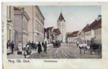
Perg erleben – www.pergmuseum.at . Heimathaus-Stadtmuseum 4320 Perg, Stifterstraße 1 Tel.: +43 (0)650 54 27 786 oder +43 (0)664 2159 788