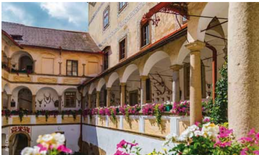
Der Arkadenhof der Burg Clam in voller Blüte.

Das Museum ist besonders sehenswert, und für jeden ist etwas dabei, seien es nun die Exponate im Apothekermuseum oder die seltenen Waffen und Rüstungen. Besonders interessant ist aber die Geschichte des Grafengeschlechtes Clam-Martinic, war doch Graf Jaroslav Martinic beim Prager Fenstersturz, der als Auslöser des 30-jährigen Krieges gilt, mit dabei. Für die Besucher der Burg gibt es noch etwas Besonderes. Ganz nach dem Motto „Schlafen wie Grafen“ lässt es sich hier residieren und so mancher freut sich bei einer „Märchentraumung“ über einen Sektempfang. Die Burg verfügt auch über eine eigene Kapelle.