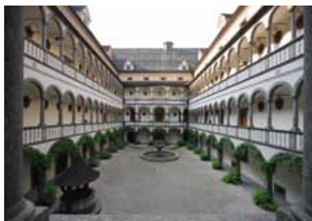
Der Arkadenhof des Schlosses Greinburg.

bis heute viele Besucher anzieht – die Sala Terrena. Ausgekleidet mit einem Mosaik aus Millionen von Donaukieselsteinen entsteht hier eine kühle Grotte mit einer künstlichen Tropfsteinhöhle. Ein Stockwerk darüber erbaut Graf Meggau den Großen Rittersaal mit einer Länge vom 30 m, einer Breite von 16 m und einer Höhe von 14 m. Es ist der früheste einheitlich überwölbte Festsaal Österreichs, der besonders mit dem einmaligen Ausblick auf die Donau besticht.