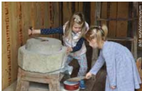
Mühlsteine im Mühlsteinmuseum von Perg 4320 Perg, Mühlsteinstraße 43 Tel.: +43 (0)664 1803253, www.steinbrecherhaus.at