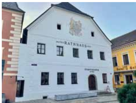
Die Fassade des Rathauses erstrahlt in neuem Glanz.

Angezogen durch den markanten goldenen Schriftzug „Stadttheater Grein“ gelangt man durch den lichtdurchfluteten Zubau ins Neue Foyer mit angeschlossenem Buffet, ein Ort, der vor und nach den Vorstellungen und natür-