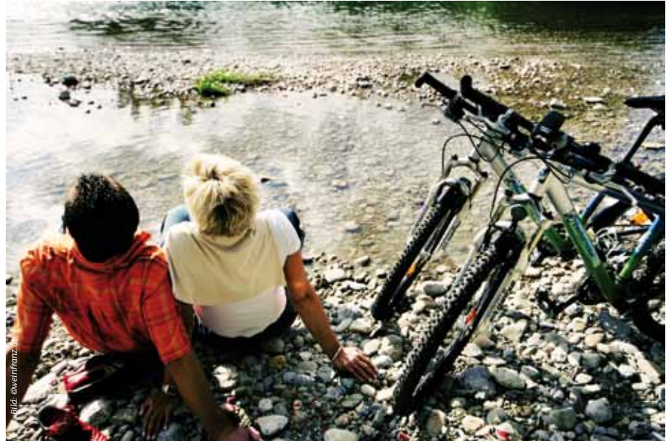
Radler am Donausteig.

Freizeitangebote: Radfahren, Wandern & Nordic Walking, Donauwellenpark, Donaustrand Ardagger, Wohnmobilabstellplatz uvm. Lassen Sie sich auch kulinarisch verwöhnen in traditionellen Gasthäusern direkt am Donauradweg!