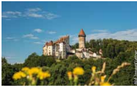
Die Burg Clam hat Geschichte geschrieben Sperken 1, 4352 Klam Tel.: +43 7269 7217, www.burgclam.com