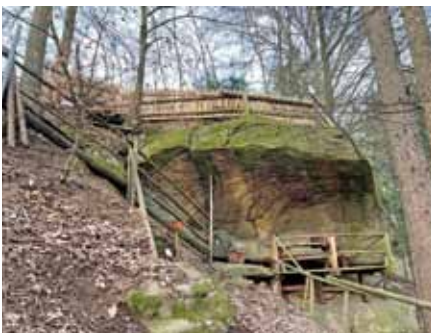
Die „Felsenruhe“ lädt im Sommer zum Verweilen ein.

Nach 300m zweigt man rechts in den Wald ab und von da an steigt es leicht hinauf zum Wahrzeichen von Münzbach, der naturgeschützten „Koppler Föhre“. Dort bietet sich dem Wanderer ein weitreichender Blick über Münzbach vom Ötscher bis zum Traunstein und hinein ins Mühlviertel. Nach 500 Metern auf der Panoramastraße „Obenstraß“ führt der Weg schließlich in südlicher Richtung über Wiesen und Felder zur Aussichtsplattform mit besonderem Ausblick vom Alpenvorland bis zur Alpenkette.