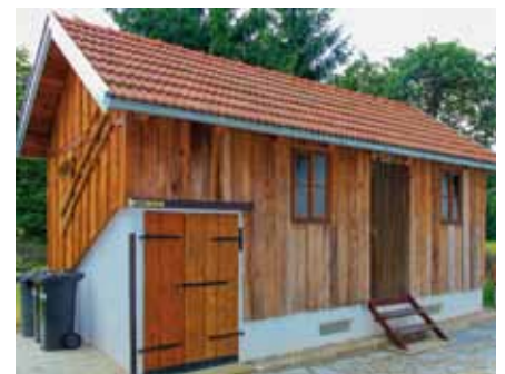
Der Überdachte Keller beherbergt alte Werkzeuge und Geräte.

Eine Besichtigung ist für Gruppen ab 8 Personen gegen Voranmeldung möglich. Die Führung durch das Haus und seine Nebengebäude inklusive einer dazugehörigen Filmvorführung dauert ca. 60 Minuten. Vom Marktplatz Naarn ausgehend lässt sich der Aulehrpfad „Naarn Au/Donau“ erleben.