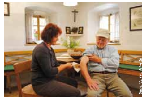
Der „Loamwickel“ hilft bei Verstauchungen.

Dazu ist 2008 eigens ein Dachdecker aus Holland engagiert worden, der sein Handwerk versteht. Der Großdöllnerhof ist aber auch modern: Unter dem Dach im ehemaligen Wirtschaftstrakt befindet sich seit 2019 ein Seminarraum mit EDV-Ausstattung und einer Bewirtungsmöglichkeit für die Gäste. Lernen Sie eine Zeit kennen, in der man noch an bösen Zauber glaubte!