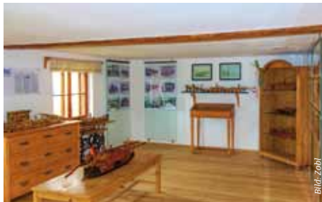
Wirtschaftsfaktor Flößern auf der Donau 4332 Au an der Donau, Oberwagram 6 www.heimathaus-naarn.at