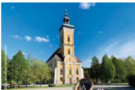
Die Stiftskirche ist eine der schönsten Kirchen Österreichs.

Christoph Colomba, dem auch die Fresken zugeschrieben werden, hat nahezu 300 farbenfrohe Fresken mit Szenen aus dem Leben Jesu und aus der Geschichte der Kirche und dieses Klosters in die Stuckrahmungen der Gewölbe gesetzt. Die sechs größten Fresken in der Mitte des