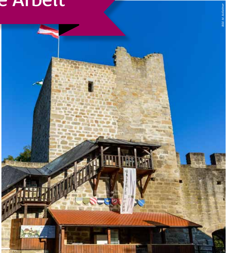
Der liebevoll restaurierte Turm der Feste die einst im Besitz der Regensburger Domherren war.

Dieses Vorhaben hat eine Gruppe von Schwertbergern aufgeweckt und zur Gründung eines Vereines veranlasst, der es sich zum Ziel gesetzt hat, die Renovierung und Reaktivierung der Ruine Windegg in Angriff zu nehmen. Innerhalb kürzester Zeit fanden sich über 300 Mitglieder im „Arbeitskreis Windegg“ zusammen und begannen spontan mit der zum Teil sehr gefährlichen und finanziell sehr aufwendigen Renovierungsarbeit.