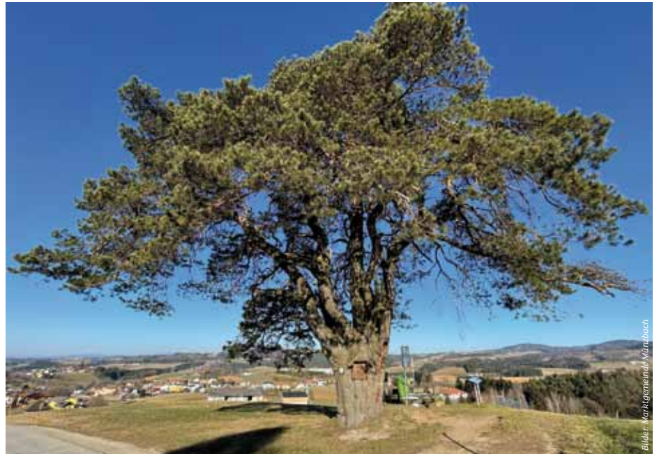
Die Koppler Föhre besticht durch ihre einzigartige Schönheit und ist das Wahrzeichen von Münzbach.

Vorbei an Marterln und zahlreichen für die Region typischen Vierkanthöfen verläuft der Sinneweg weiter Richtung Westen. Als besonders attraktiv inszenierter Rastplatz erweist sich die „Felsenruhe“, ein besonderer Kraftplatz unweit des Ortszentrums. Die Wollsackverwitterung kann hier hautnah erlebt werden. Von dort ist es nur mehr einen Kilometer bis zum Ziel, dem Marktplatz.