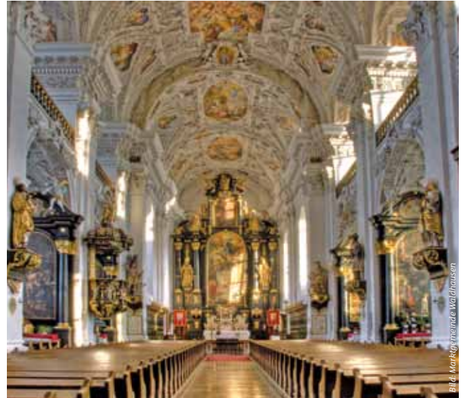
Die Ausstattung und die Fresken sind überaus prunkvoll.

Der 42 m gemauerte Glockenturm der Stiftskirche hat 1962 einen neuen 23 m hohen Turmhelm mit 2 Zwiebeln und 2 Laternen bekommen. Aus Anlass des Gusses der 2400 kg schweren Glocke im Jahre 2002 wurden die Stiegen zur neu errichteten Glockenstube erneuert, sodass man