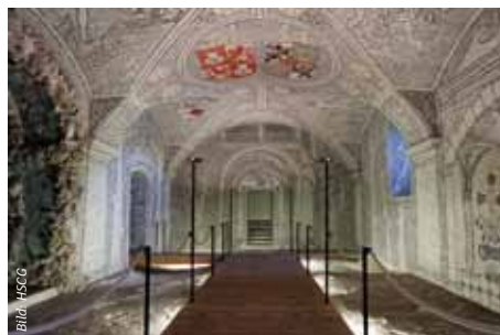
Die Sala Terrena auf der Greinburg 4360 Grein, Greinburg 1 Tel.: +43 (0)7268/700718 oder +43 (0) 664/9861981

Auf dem Schloss Greinburg wird transparent, wie der Hochadel gelebt hat und dort mit dem herzoglichen Hause Sachsen-Goburg und Gotha immer noch anzutreffen ist. In Perg ist Historisches im Steinbrecherhaus und im Heimathaus-Stadtmuseum zu finden.