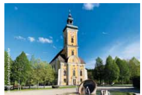
Stiftskirche & Pfarrkirche Waldhausen Anmeldungen beim Pfarramt +43 (0)7260 4251